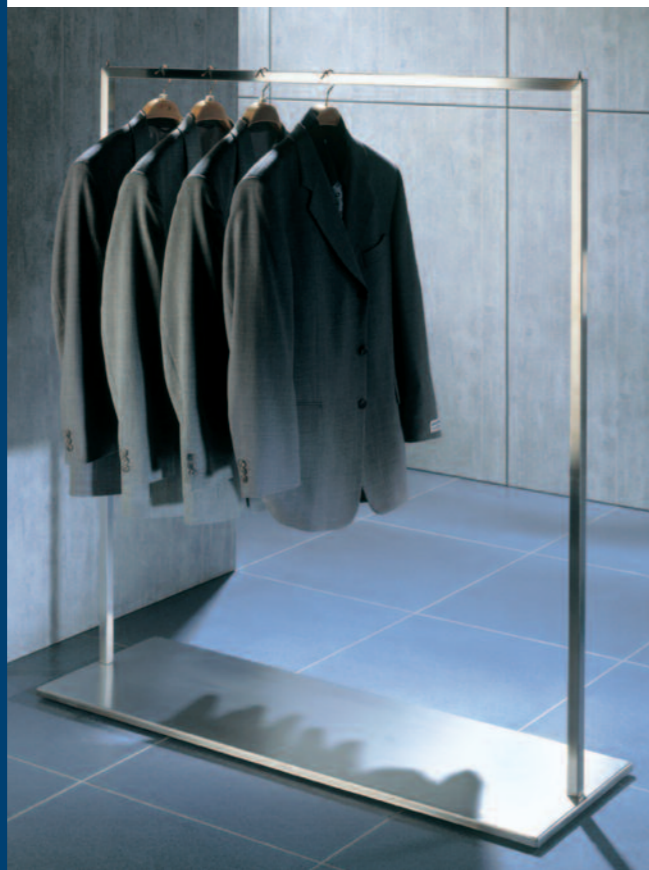
4007 Montana Schlitten Edelstahl, mit 2 Standrohren, Höhe = 1.400 mm, mit 1 Tragestange, L = 1.200 mm