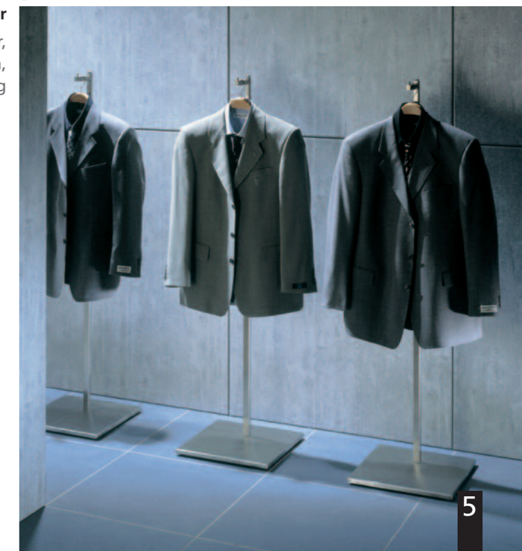
4001 Montana 1-Arm-Ständer Edelstahl, mit 1 Standrohr, Höhe = 1.000 mm, stufenlose Höhenverstellung