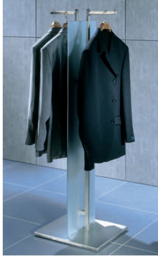
4002 Montana 2-Arm-Ständer Edelstahl, mit 2 Standrohren, Höhe = 1.000 mm, stufenlose Höhenverstellung, mit Aufnahmemöglichkeit für Glasmittelwand

Cooler Design und eine ganzheitliche Philosophie prägen dieses unverkennbare System. Die geschlossene Darstellung eines Textilsortiments innerhalb eines Shop-Milieus spricht einzelne Zielgruppen speziell und damit individueller an. Es entsteht eine bindende Kommunikation zwischen der gesamten Shop-Architektur und Ihrem Kunden. Weitere Details entnehmen Sie bitte unseren Typenlisten.